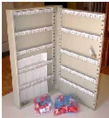
Model na 100 ks klíčů