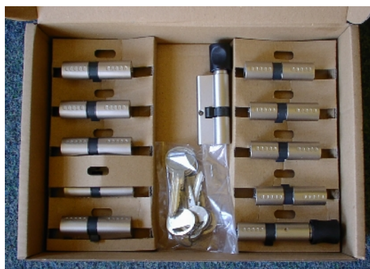
malý klíčový systém s vložkami FAB 2018

Je – li seznam dveří kompletní, zamysleme se nad tím, kolik osob bude disponovat klíči a jaká budou jejich přístupová práva. Tyto úvahy zpracujeme do tabulky (klíčového plánu), která přesně zmapuje veškeré informace o systému generálního klíče. Zpracování tabulky je odpovědná činnost, kde velmi záleží na každém detailu. Systémy generálního klíče jsou stále ještě převážně koncipovány jako stavebnice z mechanických vložek a jako takové, je nelze přeprogramovat. Proto je nutná obezřetnost při vymýšlení klíčového plánu a je nutné, předvídat růst potřeb. Do klíčového plánu vždy započítejte i případné budoucí rozšíření systému, byť se v dané etapě vložky neobjednají. To nám dá v budoucnosti možnost rozšířit systém při stavebních adaptacích, nebo organizačních změnách úřadu. Velmi podstatné je rovněž do úvah zahrnout to, kdo bude objednávat náhradní klíče a jak bude výroba náhradních dílů zabezpečena. Pokud bude klíčový systém rozsáhlejší, vyplatí se zavést klíčové hospodářství a osobu odpovědnou za klíčový systém.